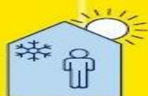
RESTEZ AU FRAIS